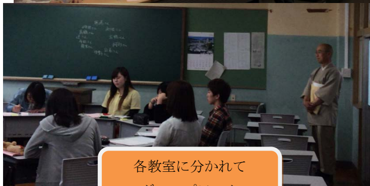
各教室に分かれて グループワーク