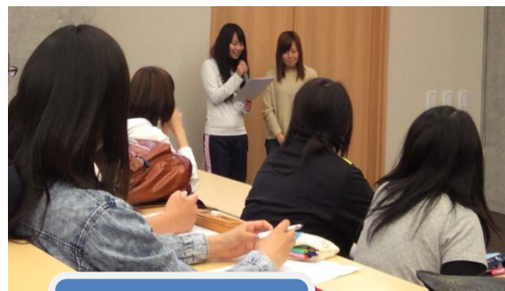
全体のまとめ 各班の発表